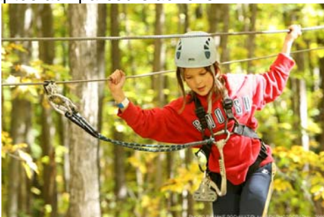
Exemple de ligne de vie continue adaptée aux parcours aériens

Le grand public doit pouvoir partir à l'aventure, en quête de sensations fortes sans pour autant mettre en jeu sa sécurité. C'est dans cette optique que Prisme développe actuellement un produit de ligne de vie adaptée aux parcours aériens.