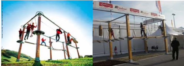
Des dimensions adaptées à vos besoins, un habillage aux couleurs de votre entreprise

Vous voulez accroître votre visibilité lors d'un salon ou bien vous faire connaître auprès des populations urbaines en plein centre des grandes villes, le CITY PARK est l'outil idéal.